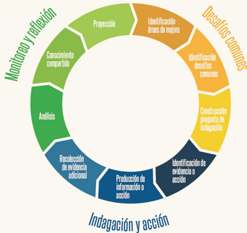
Figura 1: Fases del ciclo de indagación colaborativa elaborado por el equipo Comunidades Aprendizaje en Red (CAR), de CIAE-LIDERES EDUCATIVOS (adaptado de DeLuca et al. 2015).

La indagación colaborativa se realiza mediante un proceso cíclico, donde se identifican desafíos compartidos, se realizan acciones como la indagación en conjunto y se reflexiona sobre los resultados de estas acciones (DeLuca et al. 2015; Nelson et al. 2010). La indagación colaborativa es un proceso cíclico y en constante desarrollo.