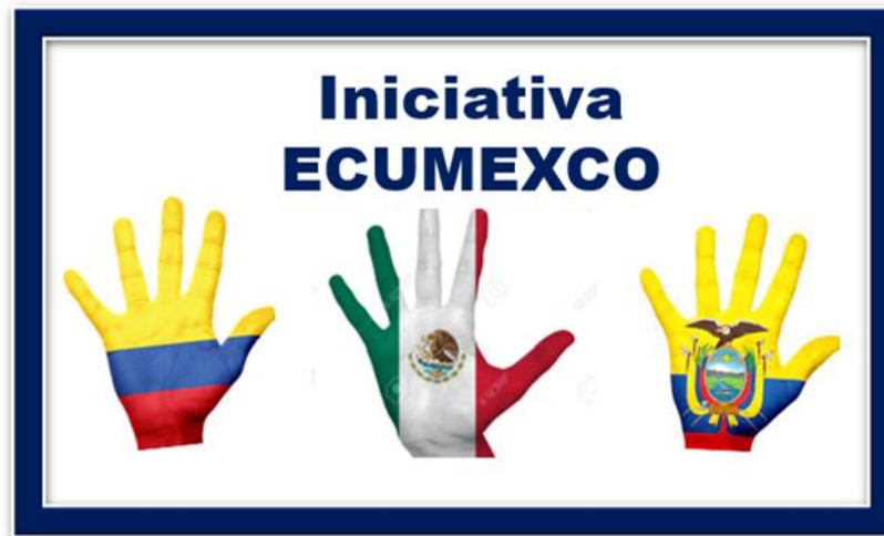
Imagen que nos representa

Conocer a los alumnos y sus expectativas para determinar estrategias que promuevan efectivamente la autonomía del aprendizaje y la motivación