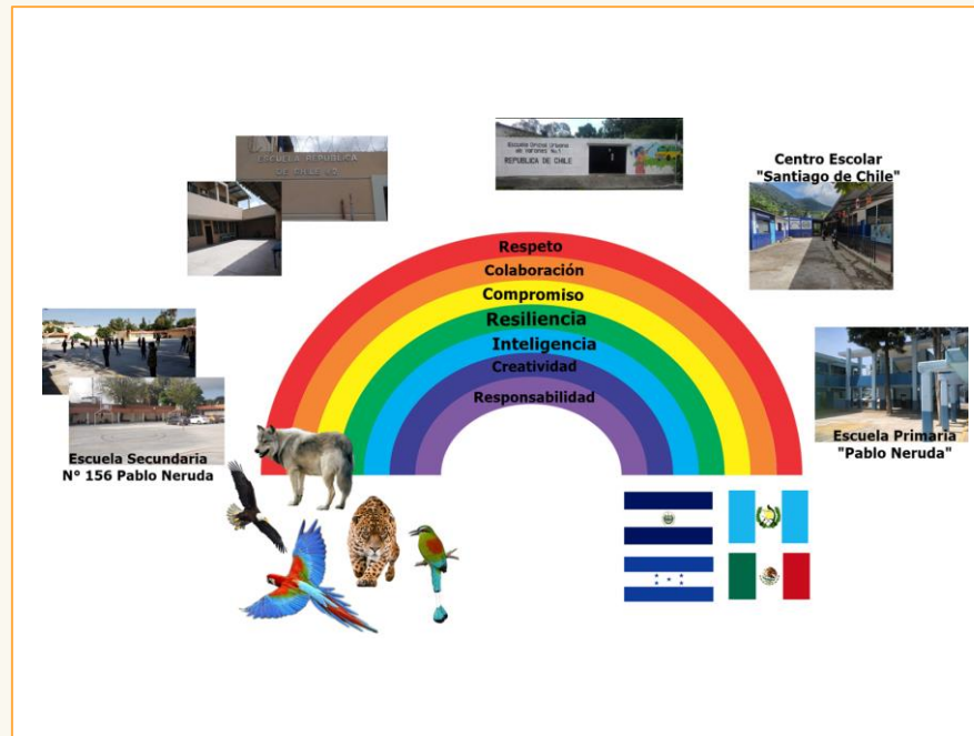
Imagen que nos representa

Motivar y apoyar al colectivo docente para fortalecer sus prácticas pedagógicas ante los nuevos desafíos.