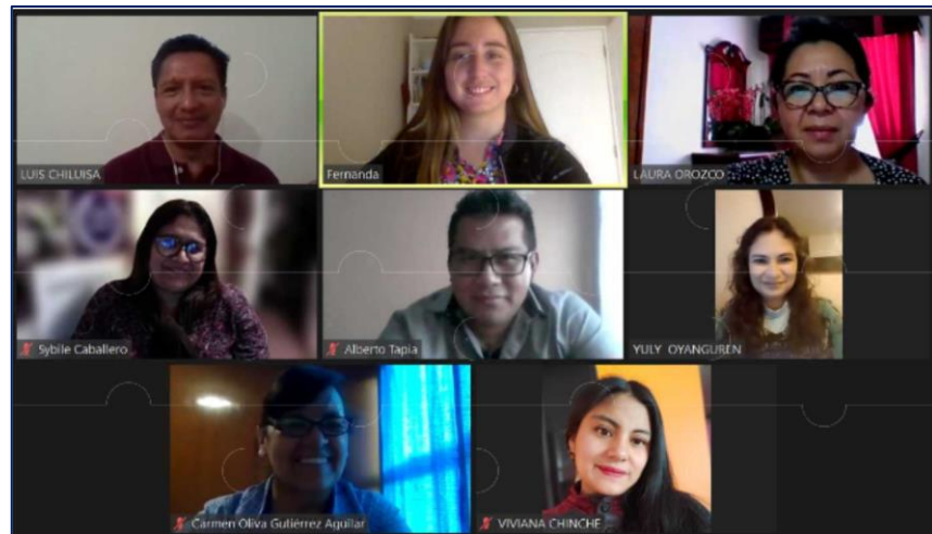
Imagen que nos representa

Promover el desarrollo de habilidades socioemocionales en docentes que permitan la generación de entornos de aula saludables propicios para el aprendizaje.