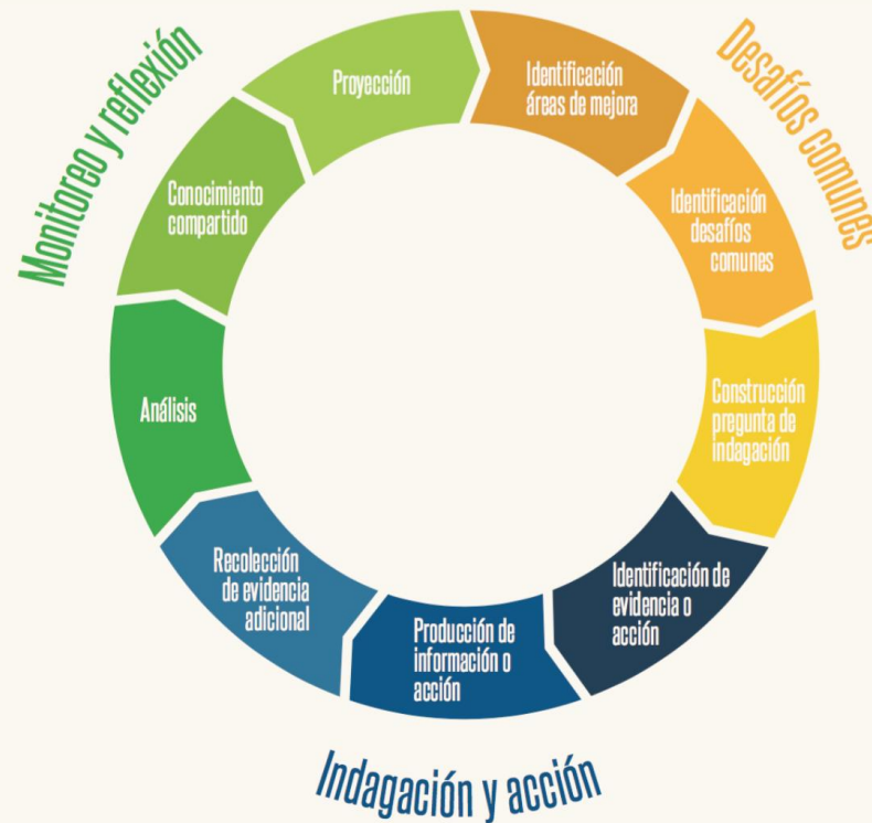
Figura 1: Fases del ciclo de indagación colaborativa elaborado por el equipo Comunidades Aprendizaje en Red (CAR), de CIAE-LIDERES EDUCATIVOS (adaptado de DeLuca et al. 2015).

La indagación colaborativa se realiza mediante un proceso cíclico, donde se identifican desafíos compartidos, se realizan acciones como la indagación en conjunto y se reflexiona sobre los resultados de estas acciones (DeLuca et al. 2015; Nelson et al. 2010). La indagación colaborativa es un proceso cíclico y en constante desarrollo.